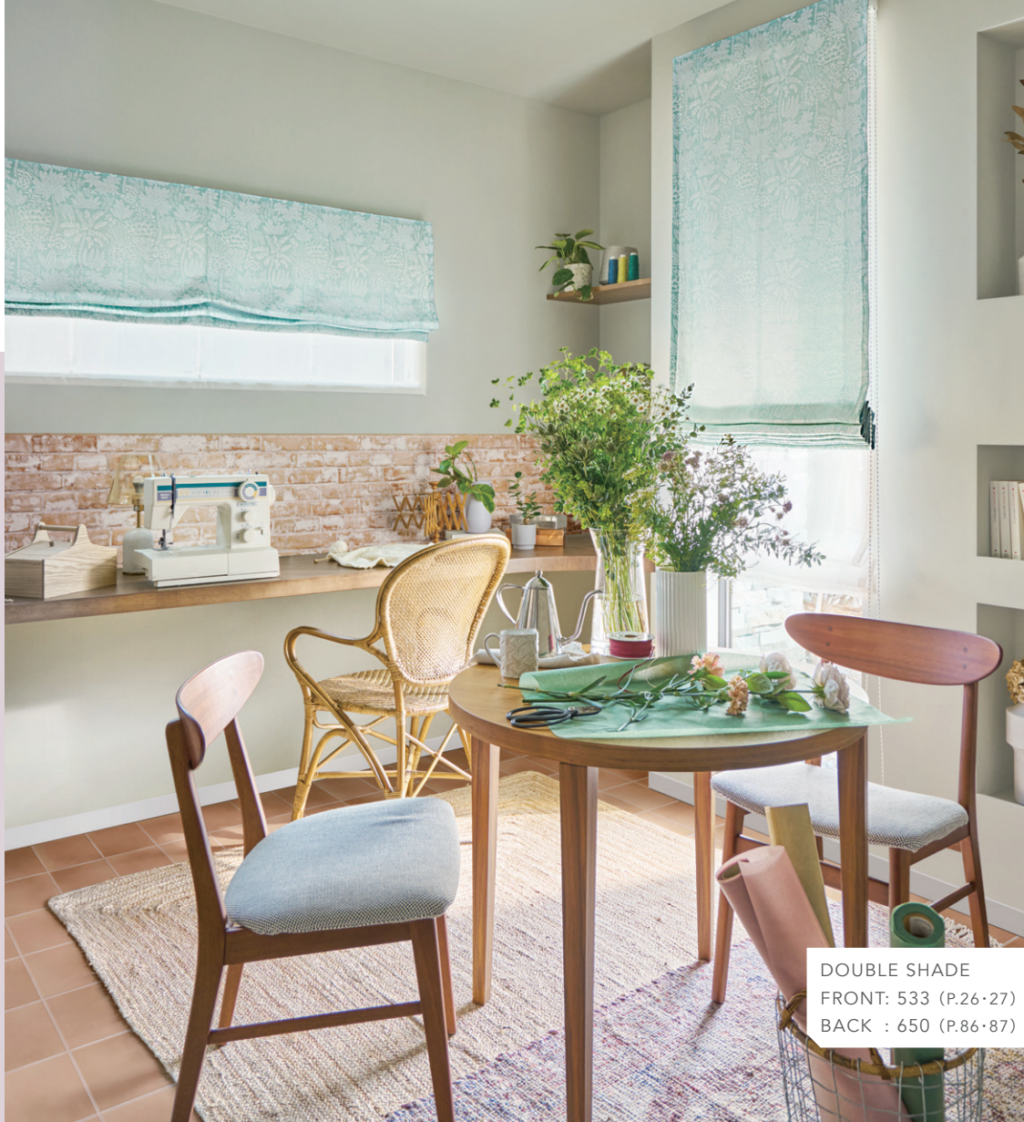
DOUBLE SHADE FRONT: 533 (P.26・27) BACK : 650 (P.86・87)