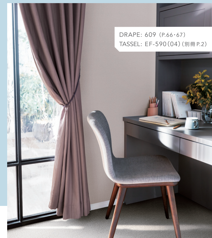
DRAPE: 609 (P.66・67) TASSEL: EF-590(04) (別冊 P.2)

明るい時間にもシアタータイムを愉しみたい。普段は外からの光が入ってきやすいお部屋でも、遮光カーテンを使うことで叶えられます。陽射しや街灯などの明るさを遮り、物語に没頭できるプライベート空間が完成します。