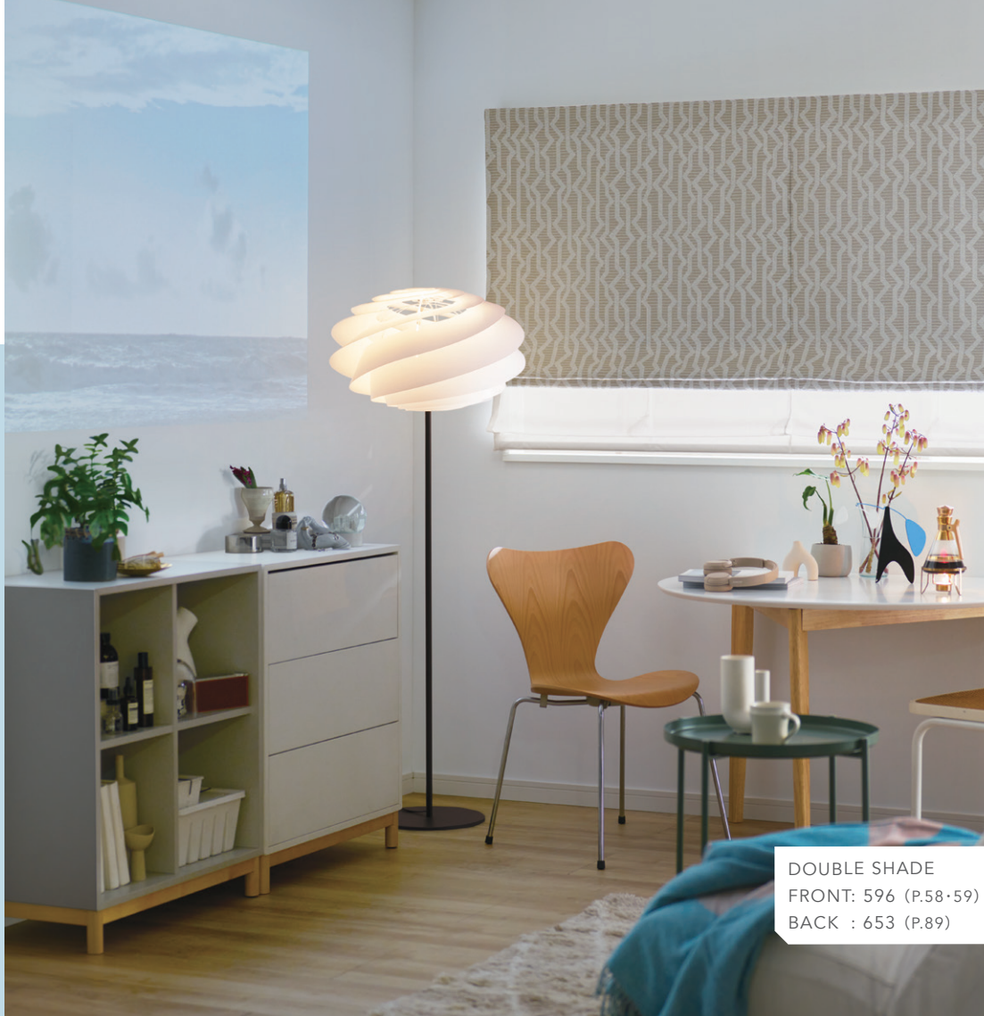
DOUBLE SHADE FRONT: 596 (P.58・59) BACK : 653 (P.89)