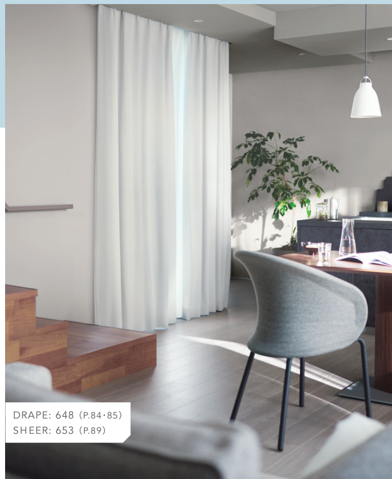
DRAPE: 648 (P.84・85) SHEER: 653 (P.89)

室内の様子を外から隠すためにも遮光カーテンは有効です。日中の寛ぎ時間も人目を気にせず過ごすことができます。ホワイトや淡い色の遮光カーテンなら空間を重たくせず、明るく軽やかな印象になります。