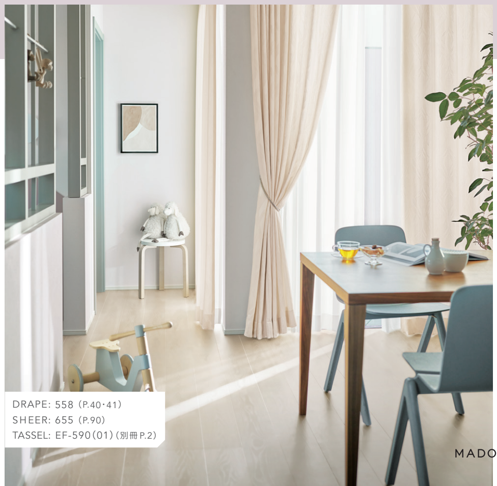
DRAPE: 558 (P.40・41) SHEER: 655 (P.90) TASSEL: EF-590(01) (別冊P.2)

トーンのまとまったシンプルなインテリア。日々の機微や出来事その時のアクセントに。カーテンも家具も空間に溶け込ませ、暮らしそのものを主役にします。