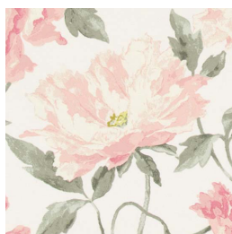
Peonies (ピオニー) ML-3368