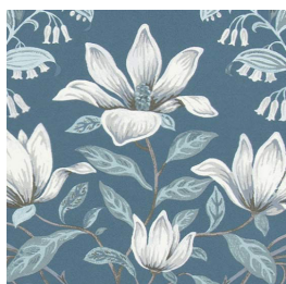
Parterre (パルテール) ML-3366

カーテン見本帳 Melodia2020-2023 Peonies (ピオニー) ML-3368