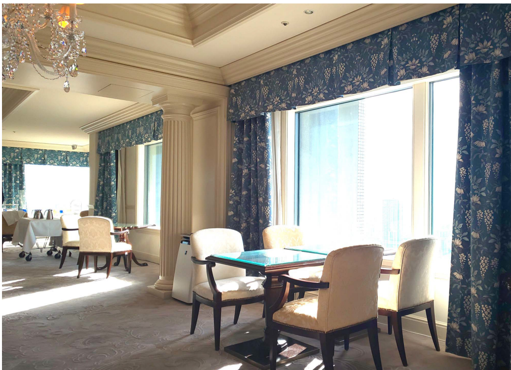
・アフタヌーンティーが楽しめるスイートルーム

カーテン見本帳 Melodia2020-2023 Parterre (パルテール) ML-3366