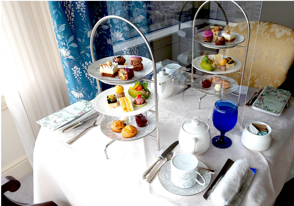
・ローラ アシュレイ アフタヌーンティー