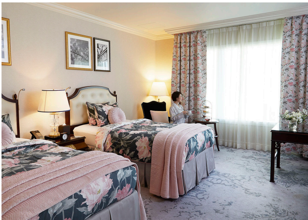
・ローラ アシュレイルーム

カーテン見本帳 Melodia2020-2023 Peonies (ピオニー) ML-3368