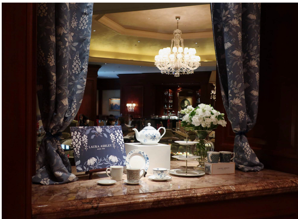
・「ザ・ロビーラウンジ」ディスプレイ

さらにローラ アシュレイのライフスタイルをより身近に感じていただくため、限定1室で、カーテンからお部屋のアメニティまでローラアシュレイのアイテムで統一した「ローラアシュレイ ルーム」が誕生しました。カーテンは華やかな「Peonies（ピオニー）」を採用いただきました。